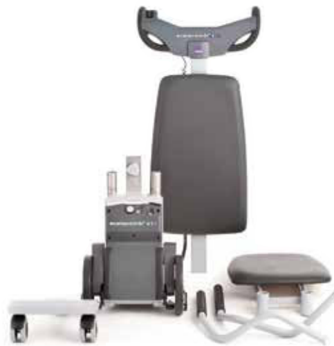
T10 smontato in 6 pezzi