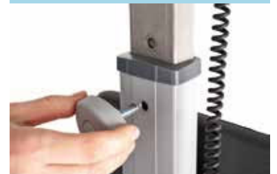
Regulación altura timón