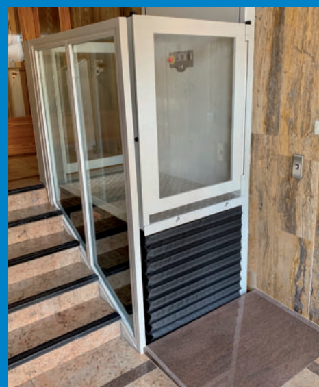
FUELLE PERIMETRAL DE PROTECCIÓN