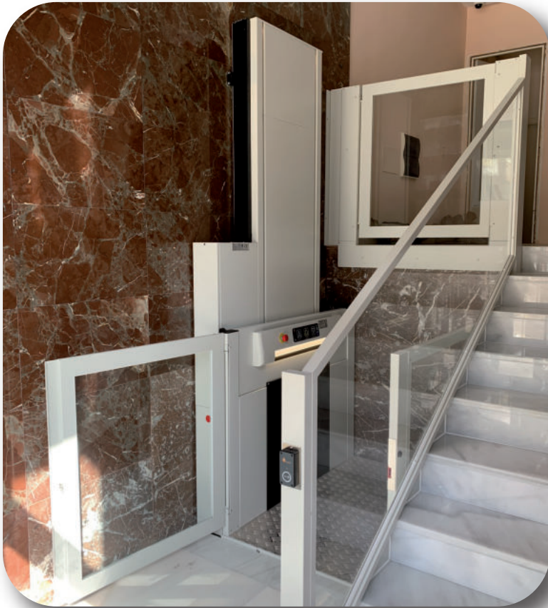
Pulsadores de abordaje sensitivos y NFC en piso