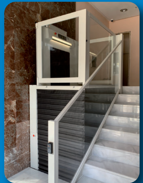
FUELLE PERIMETRAL DE PROTECCIÓN