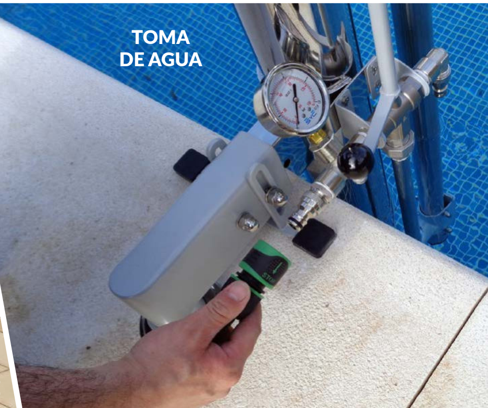
TOMA DE AGUA