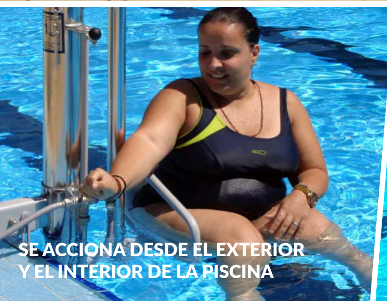
SE ACCIONA DESDE EL EXTERIOR Y EL INTERIOR DE LA PISCINA