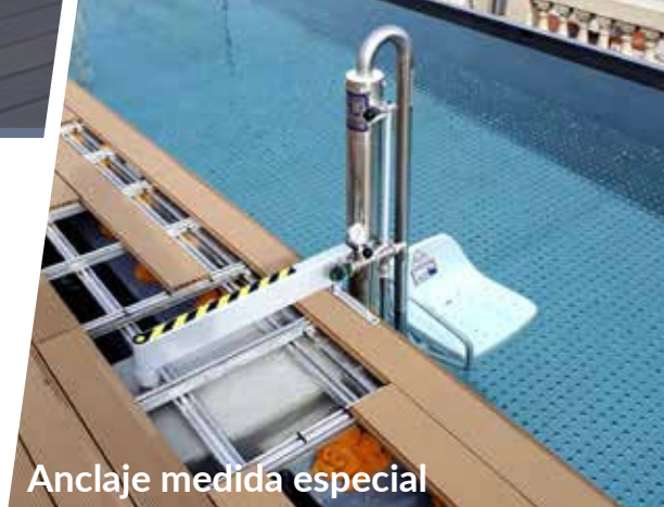
Anclaje medida especial