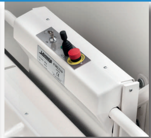
Joystick en la plataforma como opcional