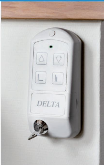
Mando de piso