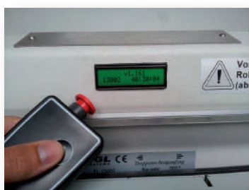
Display de diagnóstico