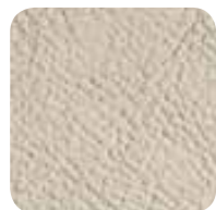
Color del asiento: marrón claro

El servoescalera Ischia ha sido proyectado y realizado para adaptarlo de la mejor manera a cada escalera: para ello se instala con facilidad, reduciendo al mínimo las intervenciones de montaje.