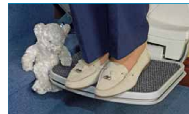
La plataforma está cubierta con un tejido resistente antirresbalamiento y cuenta con bordes de seguridad que garantizan la parada del servoescalera en caso de encontrar obstáculos durante su trayecto.

El nuevo asiento Ischia es el resultado de un profundo estudio ergonómico, basado en treinta años de experiencia en el campo de los servoescalera. Los mandos están integrados con el botón de parada de emergencia. Además, la carrocería está dotada de sensores antichoque y antiplastamiento que permiten la parada inmediata en caso de obstáculos en la escalera. El equipo se complementa con un cinturón de seguridad con enrollador automático. En cuanto respecta al confort de marcha, Ischia no tiene iguales: los cojines del asiento y del respaldo son lavables y acolchados, para garantizar la máxima comodidad de marcha. Además, gracias a la amplia rotación del asiento, la salida es fácil y cómoda.